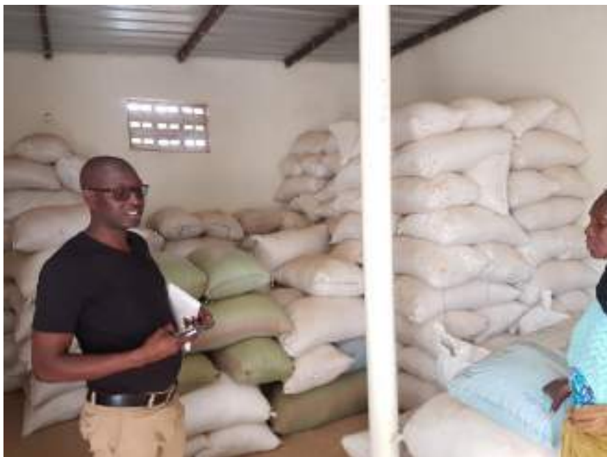
Arroz almacenado para transformación