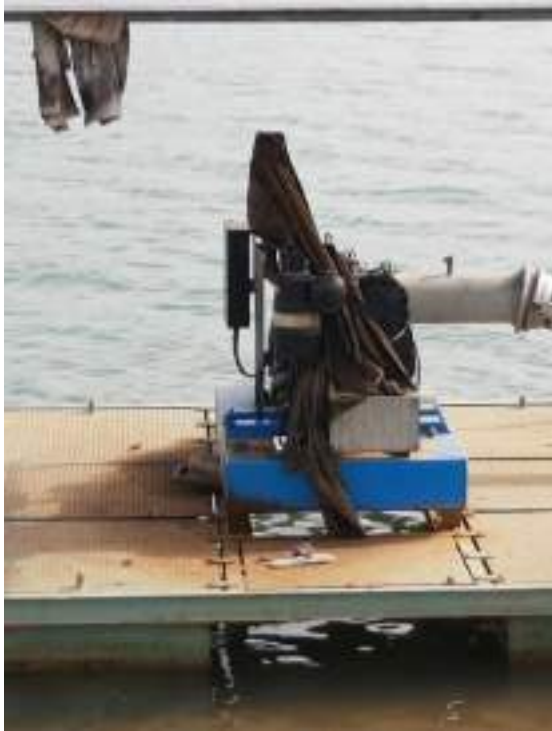
Bomba de Agua para regar los PIVS