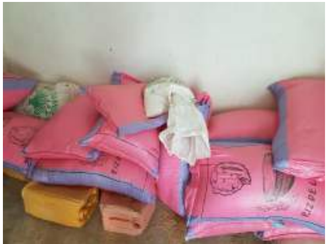
Arroz Procesado para la venta