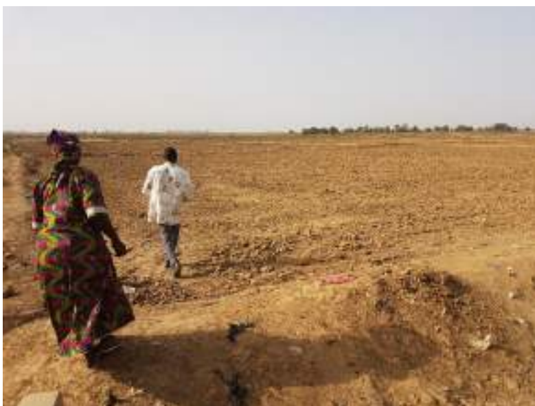
PIV empezando a ser preparado

Respecto al cumplimiento de las actividades planificadas , las evidencias muestran que desde el proyecto se han realizado todos los esfuerzos para cumplir la ejecución en el tiempo previsto y con la calidad esperada. Durante el trabajo de campo se pudo comprobar que las infraestructuras están realizadas y en buen estado de funcionamiento, si bien, por el hecho de estar en estación seca no se ha podido ver el trabajo de las bombas de agua en las canalizaciones hacia los PIVS. También se aprobó en abril de 2016, una ampliación de 6 meses de ejecución del proyecto, justificada por la propia dinámica local del proyecto.