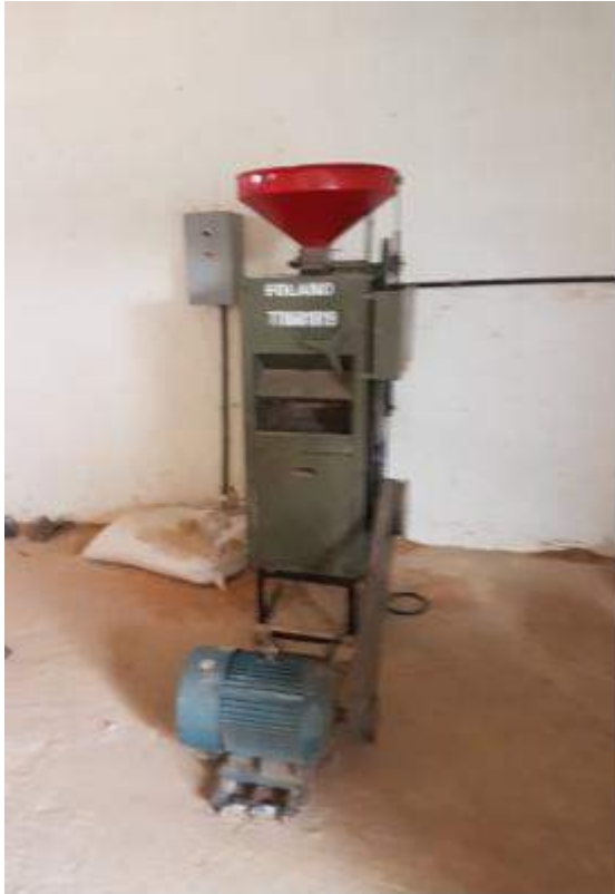
Máquina de Transformación del Arroz.