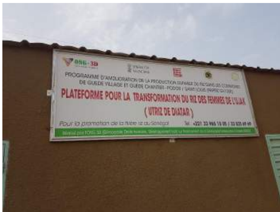
Entrada de la UTRIZ

No obstante, y dentro de todo lo positivo, las mujeres de la UTRIZ se quejan que la maquinaria se detiene y se estropea muy a menudo, quedando parada durante un tiempo sin poder transformar el arroz. En este sentido, les hubiese gustado una máquina más sólida.