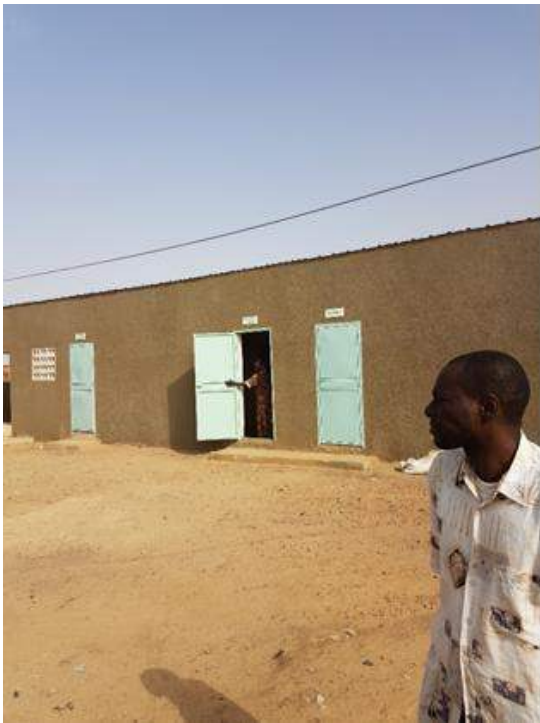
Patio exterior de la UTRIZ