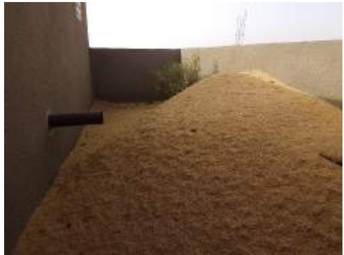
Deshechos del arroz transformado.